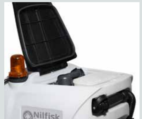
Aftageligt låg på snavsevandstanken gør maskinen let at rengøre.