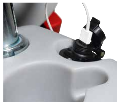
USB-port fås som tilbehør.