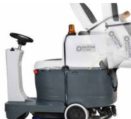
Snavevandstanken kan vippe, så der er let adgang til batterirum og Ecoflex-systemet.